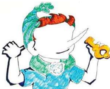
Рис. П2.3. Пример «Буратино»