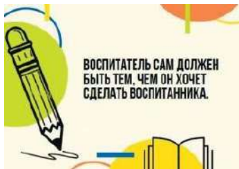
Рис. П2.2. Пример карточки с цитатой